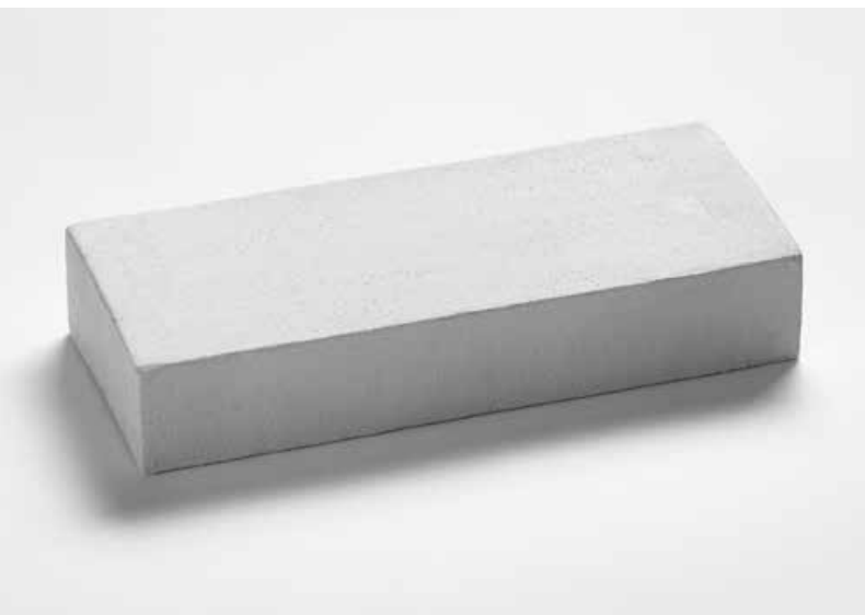
wit blok · 1960 · Kaseinfarbe und Sand auf Holz · 43 x 8 x 18 cm

In den 1950er Jahren fand herman de vries über die informelle Malerei zur Kunst, gehörte in den 1960er Jahren zum Umfeld der internationalen ZERO-Bewegung und arbeitete an seinen weißen Bildern. Aus dieser radikalen Reduktion entstand die Faszination für das Spannungsfeld zwischen Natur und Kunst, die sich seither wie ein roter Faden durch sein Œuvre zieht.