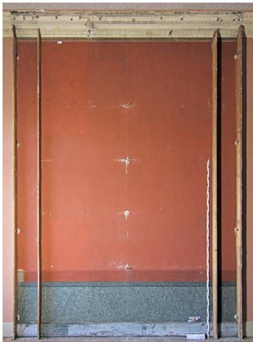
Freigelegte Originalfassung von 1876 in der Abgussammlung im 1. Obergeschoss 2020

Zusammen mit dem Sonderausstellungsraum bietet der Saal für die Abgussammlung des Lindenau-Museums den meisten Platz für Exponate. In ihm befand sich bis zum Auszug der Sammlungen auch der Gipsabguss der Paradiestür am Baptisterium San Giovanni in Florenz von Lorenzo Ghiberti. Da die „Ghiberti-Tür“ niemals von der Wand abgenommen wurde, blieb auch die dahinterliegende Wand verborgen. Erst nach der ersten Demontage des Gipsabgusses konnte einer der wertvollsten Befunde überhaupt gemacht werden: Die fast unveränderte Fassung des