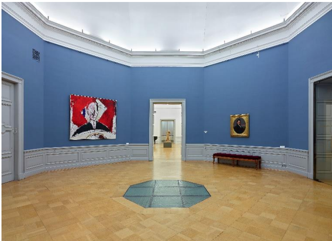
Foto des Oktogons im 2. Obergeschoss mit dem Glasfußboden 2020

An den Treppenaufgang schließt sich das 2. Obergeschoss an, dessen zentralen Punkt, wie im darunterliegenden Geschoss auch, ein Oktogon bildet. In dessen Mitte – der zentralen Kreuzung zwischen den repräsentativen Ausstellungsräumen – befindet sich ein Glasboden, dessen Untersuchung ebenfalls ein erfreuliches Ergebnis brachte. In Kooperation mit Experten vom Institut für Mineralogie der Technischen Universität Bergakademie Freiberg konnte durch eine vergleichende Analyse belegt werden, dass es sich bei dem Glasfußboden um ein bauzeitliches