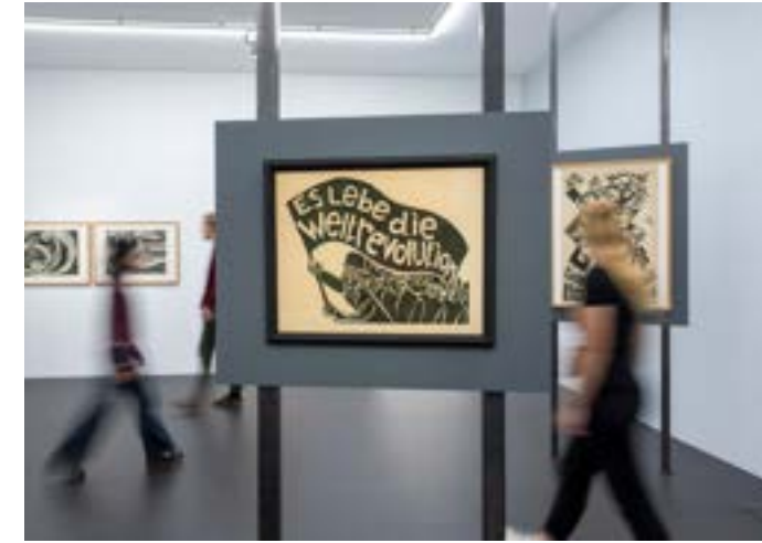
Blick in die Sonderausstellung „Modern Times“, Foto: Patrick Seeger © Museum für Neue Kunst/Städtische Museen Freiburg

MODERN TIMES Bilder der 1920er-Jahre 27. September 2024 bis 16. Februar 2025 Museum für Neue Kunst, Freiburg i. Br.