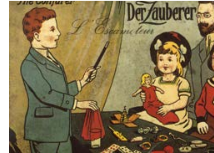
Frontseite eines Zauberkastens, 1983

Spielkartenmuseum im Residenzschloss Altenburg