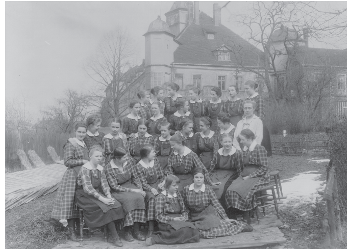
Erste Klasse des Freiadeligen Magdalenenstifts, 1924

Schloss- und Spielkartenmuseum im Residenzschloss Altenburg