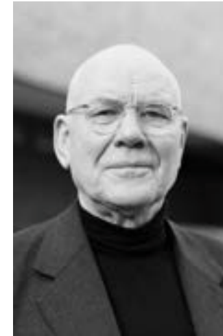
Dieter Appelt, Foto: © Inge Zimmermann

Lindenau-Museum im Prinzenpalais des Residenzschlusses