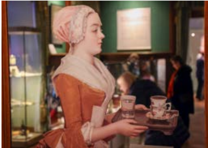
Blick in die Winterausstellung, Foto: Mario Jahn © Schloss- und Spielkartenmuseum Altenburg

Schloss- und Spielkartenmuseum im Residenzschloss Altenburg