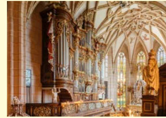
Altenburger Schlosskirche mit Trost-Orgel, Foto: Marcus Glahn, Schatzkammer Thüringen © Schloss- und Spielkartenmuseum Altenburg

ALTENBURGER KINDERMUSEUMSNACHT 7. März 2025