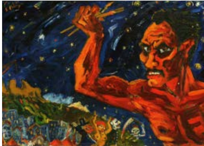
Sergio Birga, Autoportrait contre le ciel étoilé, 1965, Öl auf Leinwand, Privatsammlung Annie Birga/Paris © VG Bild-Kunst, Bonn 2025

Lindenau-Museum im Prinzenpalais des Residenzschlusses