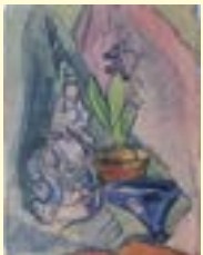
Käthe Rocco, Stillleben, 1924, Aquarell auf Papier

24. Oktober 2025 bis 11. Januar 2026 Eröffnung: Donnerstag, 23. Oktober 2025, 18 Uhr