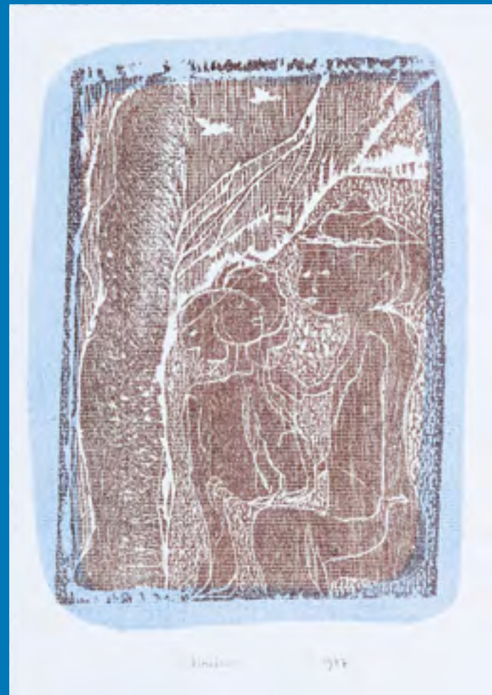
Gerhard Altenbourg, Da sitzen sie in ihrer Frühlingsfrühe die Gedanken , 1977, Farbholzschnitt mit braun-schwarzer und hellblauer Druckfarbe auf Merian Ingres-Büttenpapier in Hellgrau, Stiftung Gerhard Altenbourg

Gerhard Altenbourg, Verständigung der Auguren über ein Geschick , 1969, Aquarellfarben und chinesische Tusche auf WSH Watercolor-Papier, England, Lindenau-Museum Altenburg