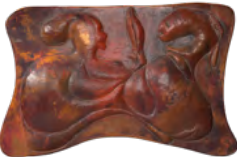
Gerhard Altenbourg, Ringelreih und Wonnentraum: da schlägt dein Herz im Zisternenlaub , 1979, geschnittenes und getriebenes Kupferblech, Foto: Lindenau-Museum Altenburg © Stiftung Gerhard Altenbourg/VG Bild-Kunst, Bonn 2026

Ausstellungseröffnung Der fantastische Gerhard Altenbourg – Ausstellung zum 100. Geburtstag