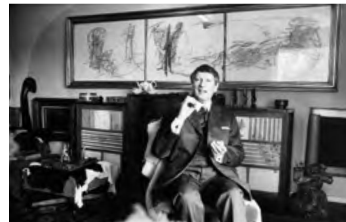
Gerhard Altenbourg im sogenannten „Atelier“ seines Künstlerhauses, 1986

Führung Weihnachten mit Gerhard Altenbourg Eintritt frei