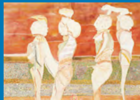
Gerhard Altenbourg, o.T. [ Wie ägyptische Göttheiten bekrönt ], undatiert, Mischtechnik auf Büttenpapier, Lindenau-Museum Altenburg

2026 feiert das Lindenau-Museum Altenburg den 100. Geburtstag des in Thüringen geborenen Künstlers Gerhard Ströch, der sich den Künstlernamen Gerhard Altenbourg gab. In der DDR lange verkannt, war er zugleich einer der wichtigsten Zeichner und Grafiker des 20. Jahrhunderts.