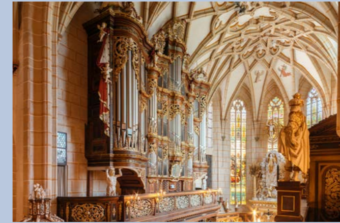
Altenburger Schlosskirche mit Trost-Orgel, Foto: Marcus Glahn, Schatzkammer Thüringen