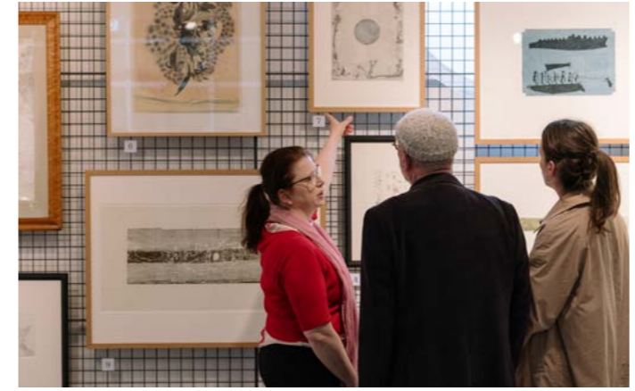
Führung zur KUNSTWAND-Präsentation, Foto: Maria Backhaus, 2025

07.07.–30.08.2026 Schlossmuseum im Residenzschloss Altenburg