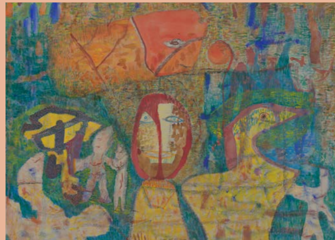
Gerhard Altenbourg, Janus und die Kinder der Zeit, 1955, Lindenau-Museum Altenburg © Stiftung Gerhard Altenbourg/VG Bild-Kunst, Bonn 2025, Foto: Altenburger Museen

Lindenau-Museum im Prinzenpalais des Residenzschlosses Altenburg