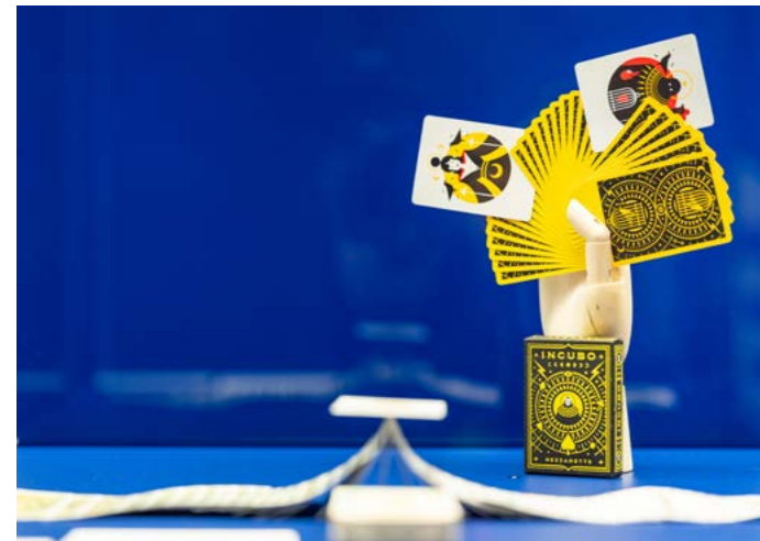
Einblick in die Ausstellung „Vom Zinken und Zaubern“, Foto: Philipp Hort, 2025

Spielkartenmuseum im Residenzschloss Altenburg