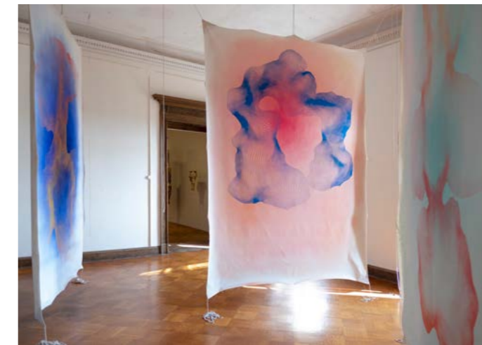
Lindenau-Förderpreis 2024, Installationsansicht von Coretta Klaue, Foto: Carsten Schenker, 2024

Lindenau-Museum im Prinzenpalais des Residenzschlosses Altenburg