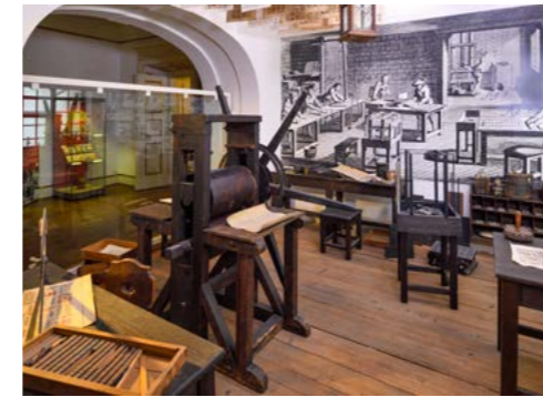
Abbildungen von links nach rechts: Dauerausstellung im Interim des Lindenau-Museums „Kunstgasse 1“ Foto: Philipp Hort, 2025

Veranstaltung im Agnesgarten mit Blick auf das Residenzschloss Foto: Philipp Hort, 2025