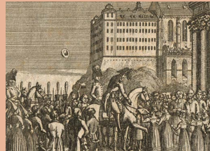
Einzug des Herzogs Friedrich in Altenburg (Detail), Schlossmuseum Altenburg, Foto: Altenburger Museen

Schlossmuseum im Residenzschloss Altenburg