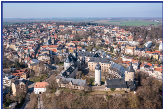
Residenzschloss Altenburg

mit Matthias Lemanski, Besucherservice mit Anmeldung, Treffpunkt: Nikolaikirchturm