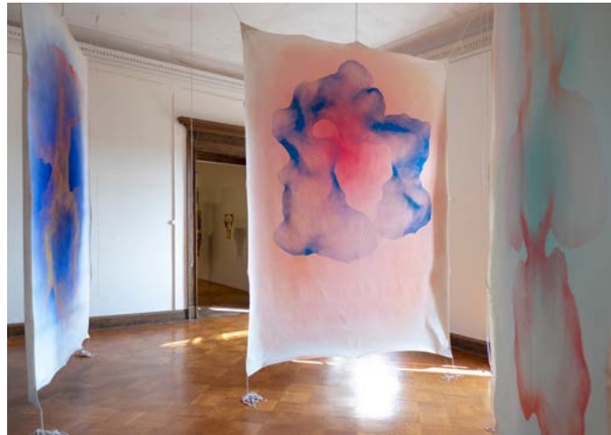
Lindenau-Förderpreis 2024, Installationsansicht von Coretta Klaue, Foto: Carsten Schenker, 2024

Lindenau-Museum im Prinzenpalais des Residenzschlosses Altenburg