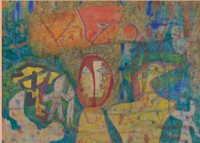
Gerhard Altenbourg, Janus und die Kinder der Zeit, 1955, Lindenau-Museum Altenburg © Stiftung Gerhard Altenbourg/VG Bild-Kunst, Bonn 2025, Foto: Altenburger Museen

Lindenau-Museum im Prinzenpalais des Residenzschlosses Altenburg