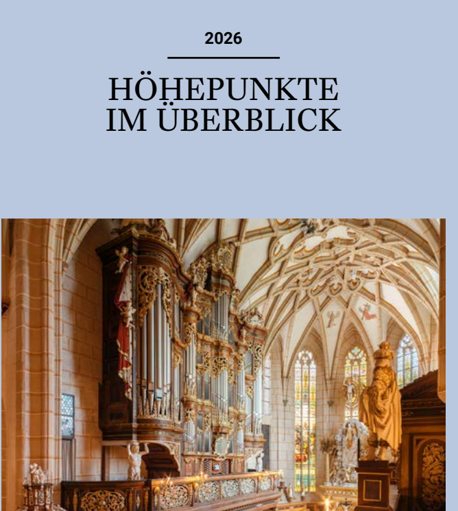
Altenburger Schlosskirche mit Tröst-Orgel

Präsentationen 14. LANDESFOTOSCHAU THÜRINGENS 2026 07.07.–30.08.2026 Schlossmuseum im Residenzschloss Altenburg KUNSTWAND-Präsentationen Lindenau-Museum „Kunstgasse 1“ WAS MACHT DIE KUNST? Werke der Dozentinnen und Dozenten des studio 23.01.–12.04.2026 Eröffnung: Donnerstag, 22.01.2026, 18 Uhr NARREN UND NORDLICHTER Grafische Arbeiten von Rolf Münzner 17.04.–12.07.2026 Eröffnung: Donnerstag, 16.04.2026, 18 Uhr OH, WIE SCHÖN! Frisch restaurierte Werke aus den Altenburger Museen 17.07.–18.10.2026 Eröffnung: Donnerstag, 16.07.2026, 18 Uhr FASZINATION ETRUSKER Provenienzforschung in der archäologischen Sammlung des Lindenau-Museums Altenburg 23.10.2026–24.01.2027 Eröffnung: Donnerstag, 22.10.2026, 18 Uhr