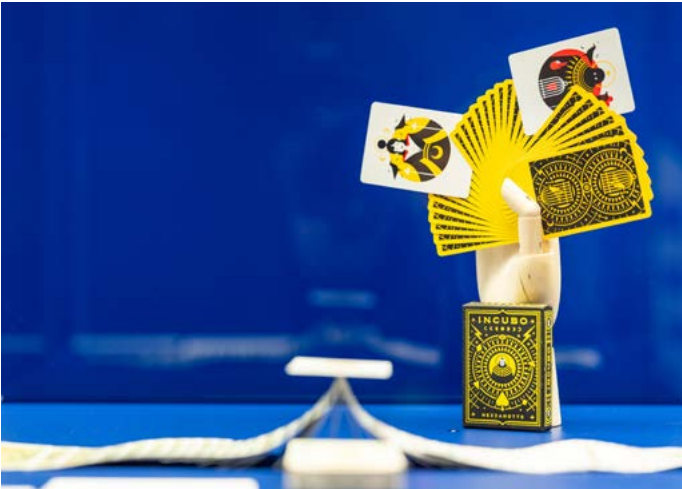
Einblick in die Ausstellung „Vom Zinken und Zaubern“, Foto: Philipp Hort, 2025

Spielkartenmuseum im Residenzschloss Altenburg