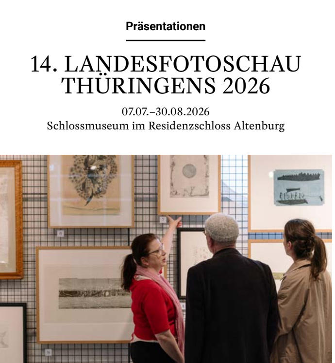
Führung zur KUNSTWAND-Präsentation, Foto: Maria Backhaus, 2025

Abbildungen von links nach rechts: Dauerausstellung im Interim des Lindenau-Museums „Kunstgasse 1“ Foto: Philipp Hort, 2025 Veranstaltung im Agnesgarten mit Blick auf das Residenzschloss Foto: Philipp Hort, 2025 Konzert im Festsaal des Residenzschlosses Foto: Philipp Hort, 2025 Einblick in das Spielkartenmuseum im Residenzschloss Foto: Lutz Ebhardt, 2022