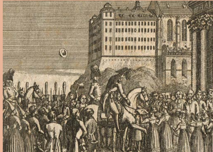
Einzug des Herzogs Friedrich in Altenburg (Detail), Schlossmuseum Altenburg

Schlossmuseum im Residenzschloss Altenburg